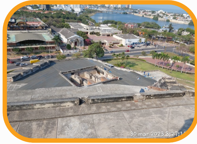
✓ IMPERMEABILIZACION CASTILLO SAN FELIPE CARTAGENA DE INDIAS – CLIENTE: ESCUELA TALLER CARTAGENA DE INDIAS.