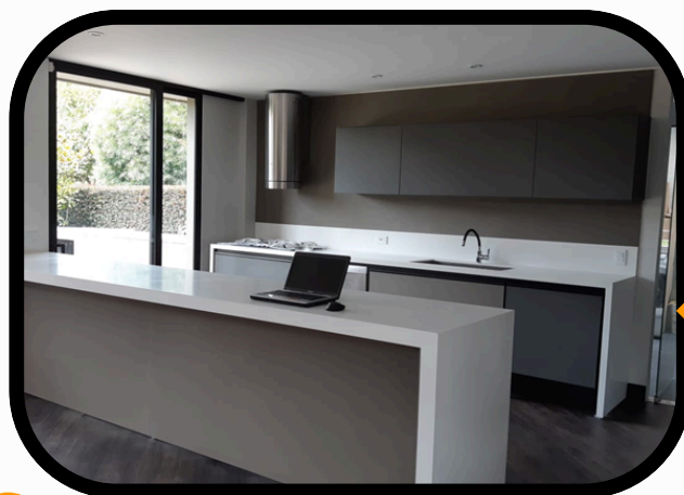
✓ REMODELACIÓN VIVIENDA COTA