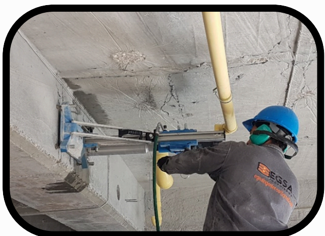
✓ CONSTRUCCION DE REDES HIDROSANITARIAS Y DE GAS – CLIENTE ANROCA SAS – EDIFICIO ABITAT 51