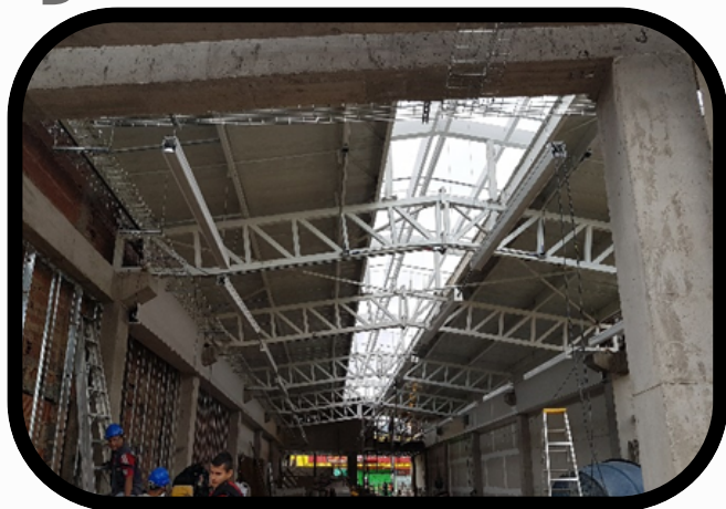
✓ CONSTRUCCION TIENDAS ARA – CLIENTE JMV CONSTRUKTORA SAS