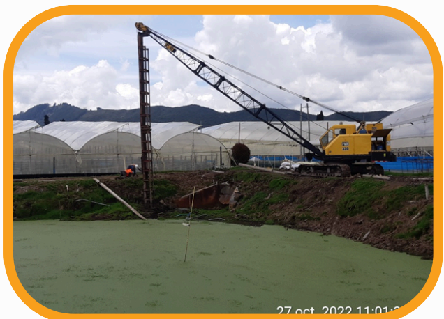
✓ INTERVENTORIA ESTABILIZACION RESERVORIO CHIA – CLIENTE ECOFLORES SAS